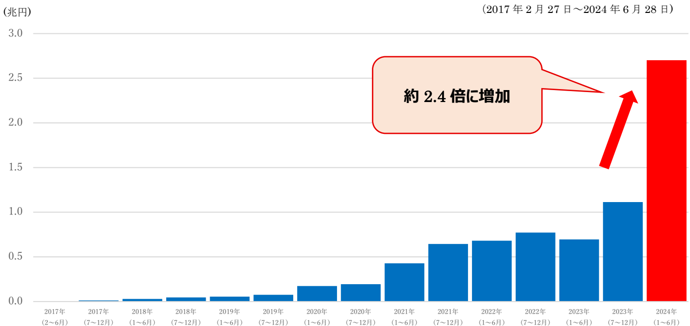
【図表1】eMAXIS Slim シリーズの資金流入金額の推移

※上記は過去の実績・状況であり、将来の運用状況・成果を示唆・保証するものではありません。